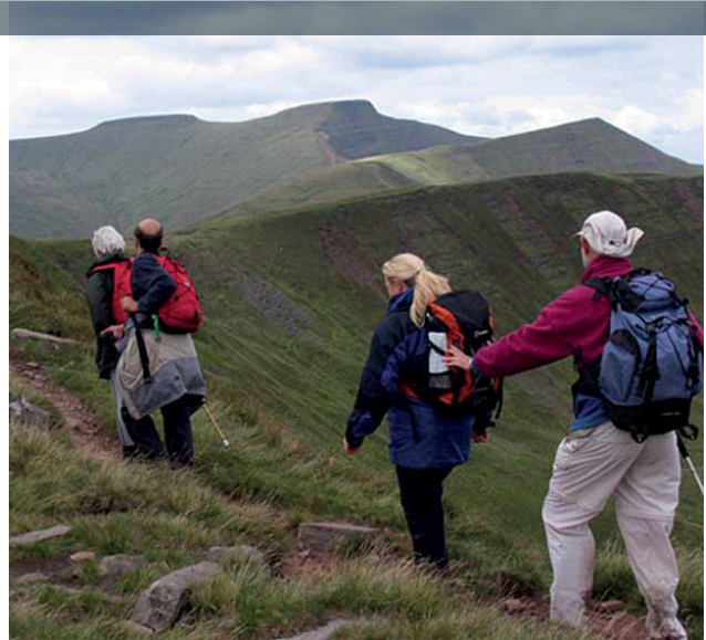
Teithiau cerdded wedi'u tywys i bobl rhannol ddall