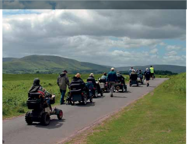
Gwibdaith cerddwyr anabl ar Fynydd Illtyd

Mae Llywodraeth Cynulliad Cymru (LICC) yn rhagweld y bydd tri Pharc Cenedlaethol Cymru yn cael eu mwynhau a'u coleddu gan drawstoriad llawn o'r gymdeithas. Mae hyn yn gofyn i'r APCau a'u partneriaid ymgysylltu'n fwy effeithiol