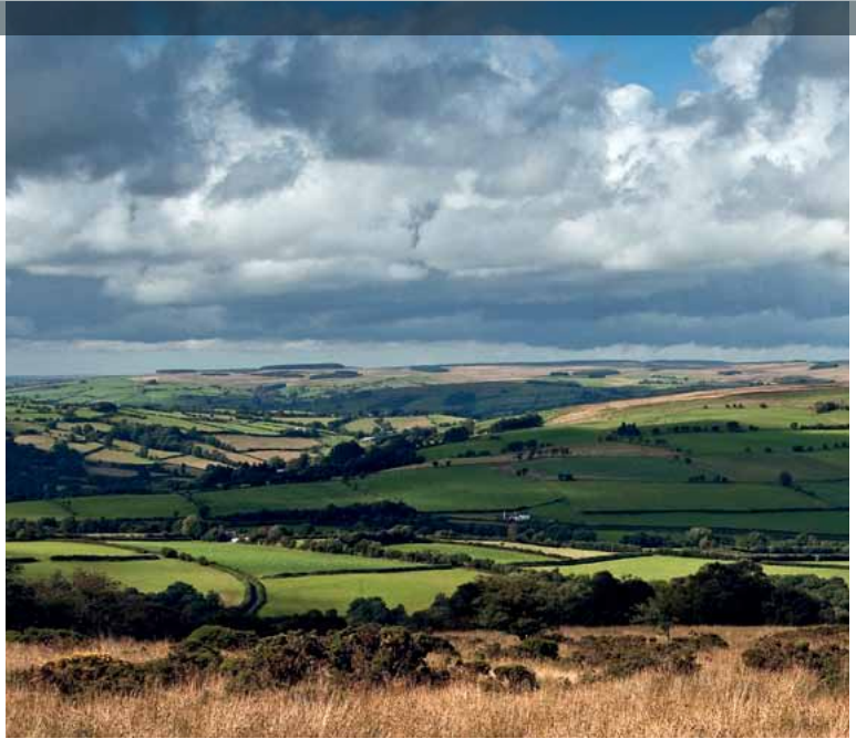
Golygfa ger Crai

partneriaeth â'r buddiannau hyn, mae LICC yn awyddus i ddefnyddio dyletswydd Adran 62(2) yn effeithiol i helpu i fod yn sylfaen i weithio mewn partneriaeth hyd yn oed cryfach - gan gydnabod bod y Parc yn ased arwyddocaol ar gyfer Cymru a'r DU ac nid yw'n gyfrifoldeb unrhyw un corff statudol yn unig.