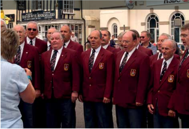
Côr Meibion Aberhonddu