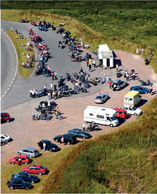
Cilfan ger Storey Arms