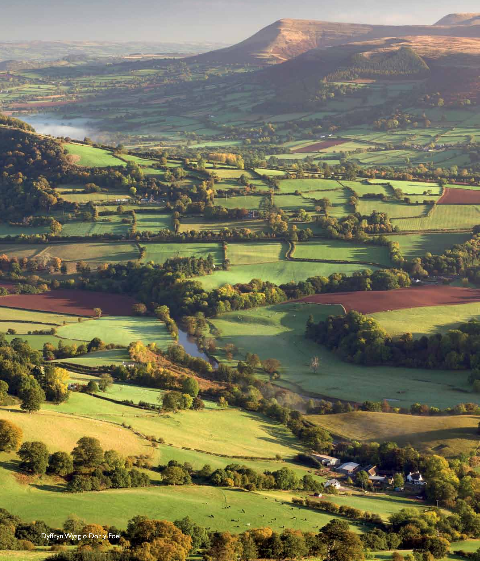
Dyffryn Wysg o Dor y Foel