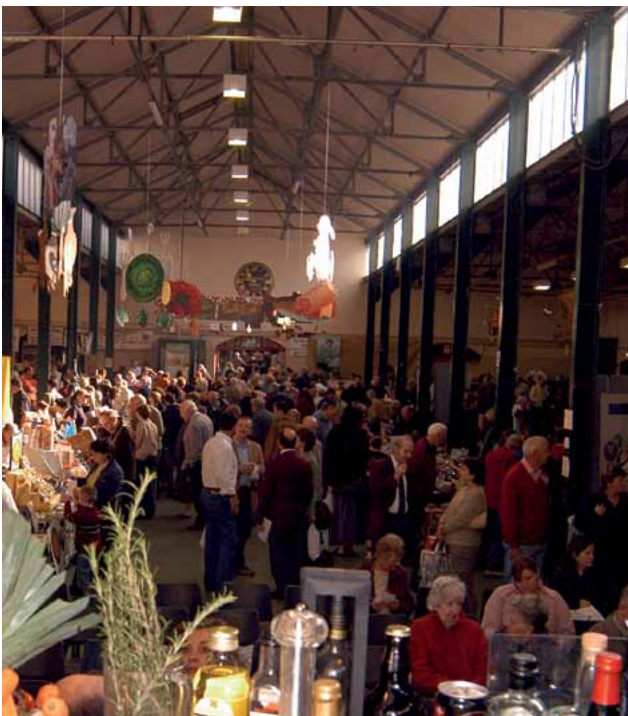
Gŵyl Fwyd Bannau Brycheiniog

buddsoddiad. Mae adfywio ardal angen cynllun tymor hir, cyd-drefnus. Hefyd mae buddsoddiad o'r fath angen cefnogaeth y gymuned leol i fod yn hollol effeithiol. Mae hyn, yn ei dro, angen partneriaethau effeithiol a rhwydweithiau cefnogi i alluogi adeiladu gallu lleol, helpu pobl leol i ddatblygu sgiliau ac adeiladu hyder. Y nod yw gwella'r ysbryd cymunedol a naws am le, yn ogystal â'r ymddangosiad ffisegol a gwneud aneddiadau'n gynaliadwy yn y dyfodol.